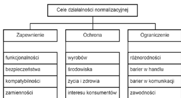
Rys. 2. Podstawowe cele działalności normalizacyjnej krajowych i międzynarodowych organizacji normalizacyjnych Fig. 2. The basic goal of the standardization activity of national and international standardization organizations

Normalizacja obejmuje praktycznie wszystkie obszary aktywności gospodarczej społeczeństwa, co w przybliżeniu uwidoczniło na rys. 2, i dostarcza potrzebnych produktów (dokumentów normalizacyjnych do dobrowolnego stosowania, a w przypadku standaryzacji - stosowania obowiązkowego).